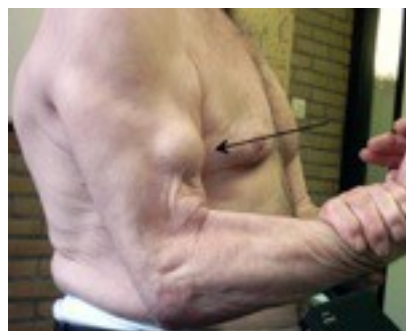
Figuur 4.4: Volledige ruptuur